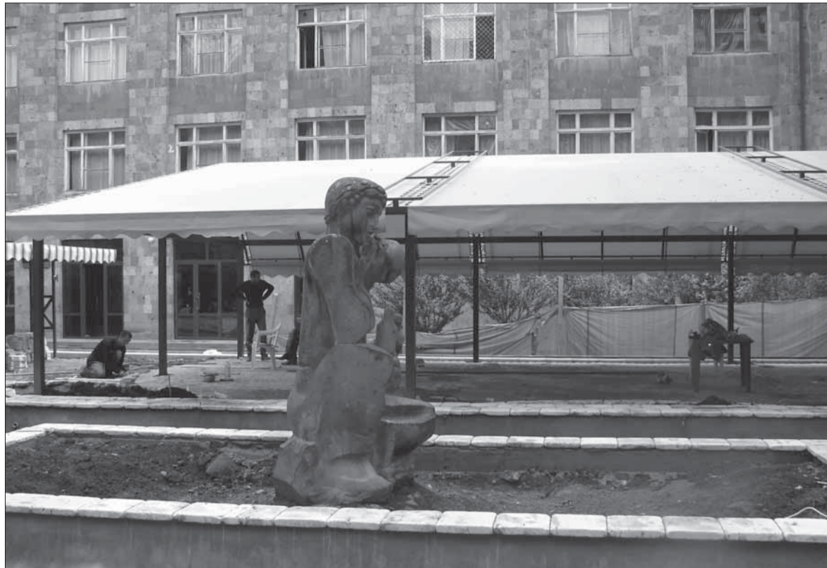
Կապանի արվեստի ջրլեռնի բակում հերթական սրճարանն է կառուցվում: