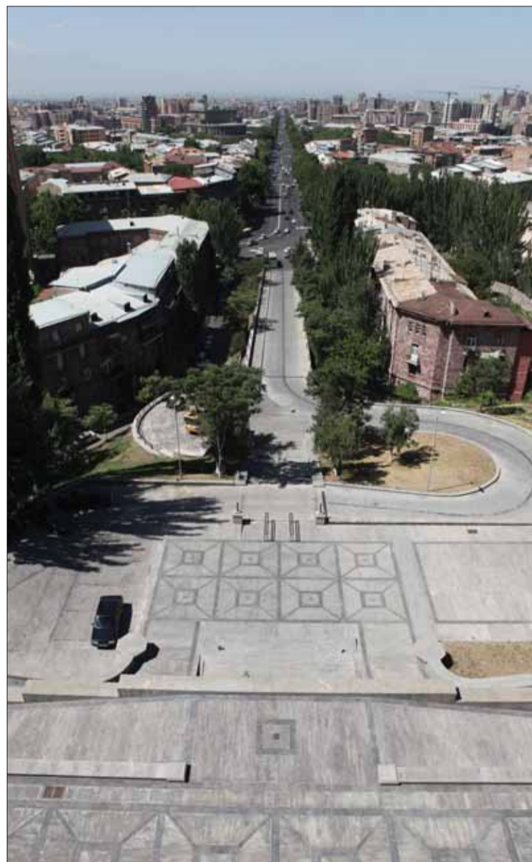
Մատենադարան շենքը Գառնիկ Յովակիմյանի և հարթակները