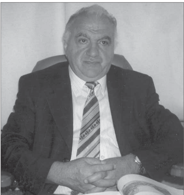
Սահյանով հետաքրքրվող գրքում կհանդիպի նրա կյանքին ու գրական գործունեությանը նվիրված մեծագրությունների, բոլոր բանաստեղծական ժողովածուների մասին, հայերեն, ռուսերեն և այլ լեզուներով, տեղեկություններ: Սահյանի՝ «Годы мои» բառահոդվածում կարդում ենք. Ռուսերեն թարգմանված բանաստեղծությունների ժողովածու, լույս է տեսել 1971-ին Երևանում, 151 էջ, տպաքանակ՝ 5000, «Հայաստան» հրատարակչություն: Ժողովածուի առաջաբանը գրել է ռուս թարգմանչուհի Ալլա Մարչենկոն, կազմել է Լեոն Մկրտչյանը, թարգմանիչներն են Արսենի Տարևականյան, Մարիա Պետրովիչը, Նաոմ Գրեքմյուլը, Ալլա Մարչենկոն, Բորիս Պաստերնակը, Տատյանա Սպենդիարովան, Վերա Զվյագինցեան և ուրիշներ:

— Ինչ վերաբերում է հանրագիտարանին, էթ է չեն սխալվում, մեզ գնում այդպիսի փորձ չի ձեռնարկվել, հանրագիտարանային կառուցվածք ունեցող այս միատարրական ընդգրկում է 261 բառահոդված՝ կապված գրողի հետ և 100-ից ավելի լուսանկար: Թեմատիկ առումով բառագիրը ընդգրկում է բառահոդվածներ հայ գրավեստի մեծերի և ակադեմիկոս արվեստի մասին, որոնց վաստակը փորձել է գնահատել Սահյանը, տեղ է հատկացված այն գրականագետներին, գրաքննադատներին, քարոզմանիչներին, ովքեր խոսք են անել Սահյանի մասին՝ որպես բանաստեղծ, մտածող և մարդ: