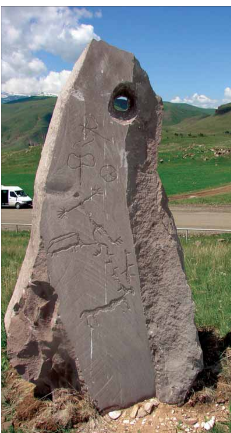
Աշոտ Ավագյանի հեղինակած Ջորաջ քարի նմանակը