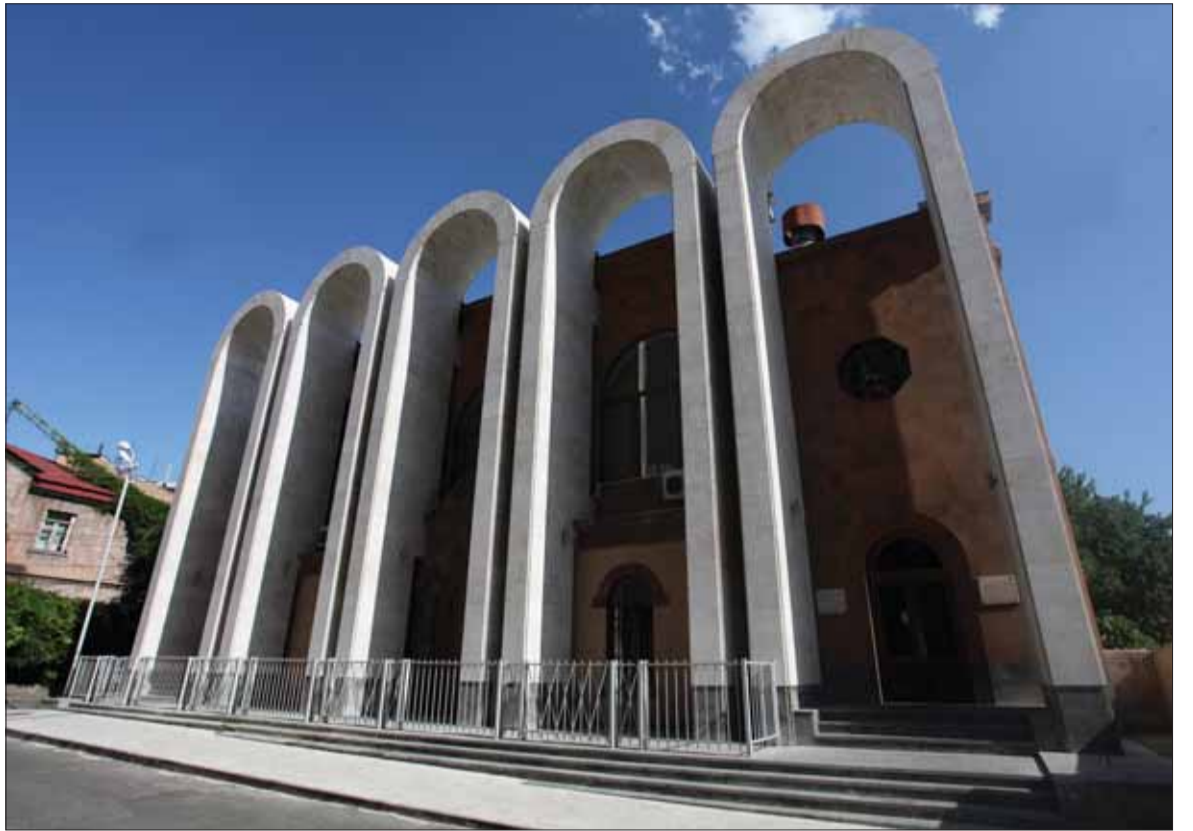
Երեւան, Արամ խաչատրյանի փուն-թանգարանի կամարաշարը

Շնորհակալություն հայտնելով նոր համալիրի ճարտարապետին՝ Արթուր Մեսչյանին, նախագահն ասել է, որ այդ կառույցով նա դարձել է 20-րդ դարի հայ ճարտարապետության փայլուն ներկայացուցիչ Մարկ Գրիգորյանի արժանի ժառանգորդն ու յուրատեսակ գործընկերը՝ շարունակելով նրա ստեղծած գործը եւ հավատարիմ մնալով նրա ստեղծած շենքի ոգուն ու տրամաբանությանը: Եվ ամեն ինչ սրանով չավարտ-